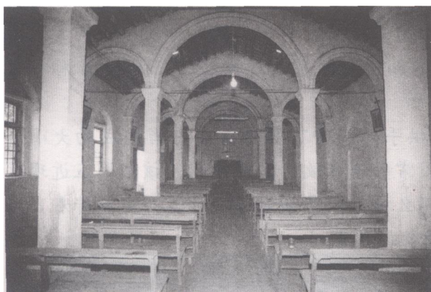
圣母堂祈祷厅内景