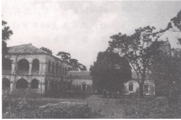
濶洲城仔圣母堂全景。前为钟楼，中为祈祷厅，后为神父楼