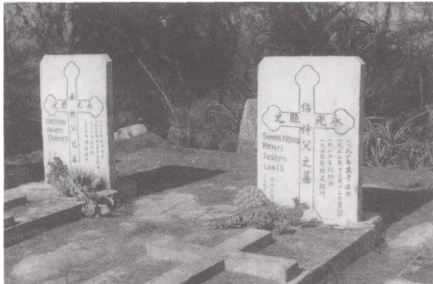
信神父和嘉神父的遗骸由濶洲天主教会安葬在盛塘村外的圣地公墓。图为信、嘉两神父的墓莹