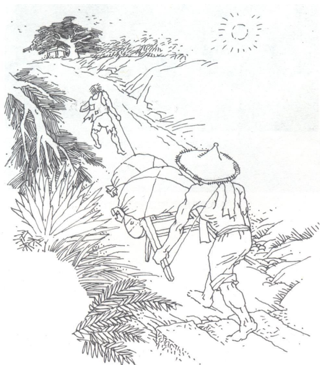
昔日“拉车头”的情景

解放后，“拉车头”这条小路已被拓建成宽达30米的现代化大路。为纪念“茶亭”历史上的善举，市政府把该路命名为“茶亭路”。现在“鸡公车”已经绝迹，“拉车头”的长坡也已填平，“茶亭”旧址和那棵古榕树已不复存在，惟有“拉车头”的村名作为我市法定的地名保留至今。老北海在茶余饭后闲聊中，偶尔忆起这条昔日的“拉车头”小路还觉得饶有兴味。