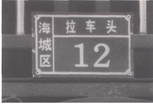
一户人家的“拉车头”门牌