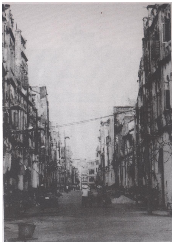
东泰街和接龙桥被拓建后统称珠海东路