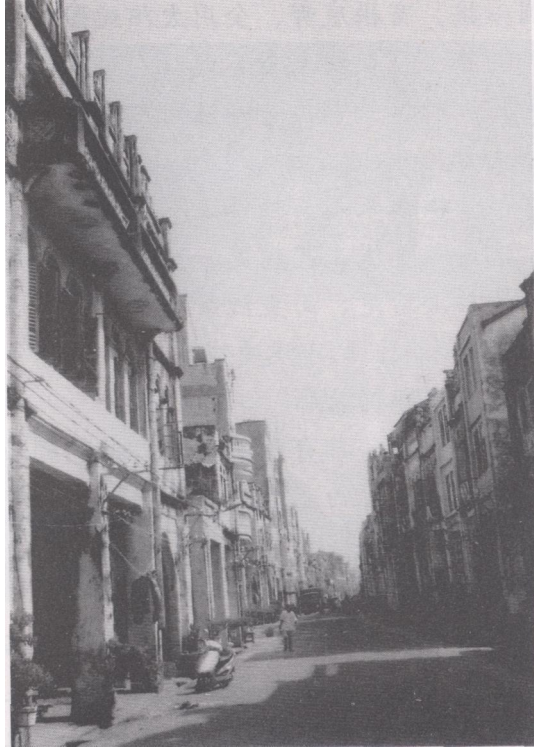
东华街被拓建后称珠海中路