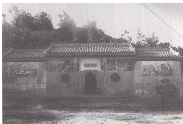
图为二十世纪80年代末重建的地角大王宫

大王宫于解放前曾为地角小学的校址，解放后庙宇被毁，建成地角小学。1988年底，经郊区地角镇政府申请、市有关部门批准，在地角岭主峰炮台临海处一带建立“地之角文化公园”，园内景点有三个：一是地角炮台（共3座）；二是海滨浴场；三是重建的大王宫。大王宫新址坐落在地角岭主峰（又称匙羹岭）下临海的山腰处。大王宫虽然历经百年沧桑，但地角的老渔民至今还能说出许多不同“版本”的优美神话传说。