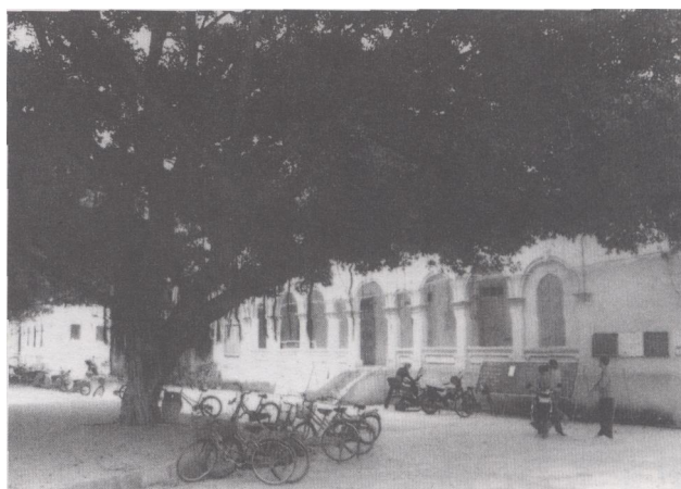
今市一中校内的双孖楼旧址，往昔曾一度为广州圣三一中学校址