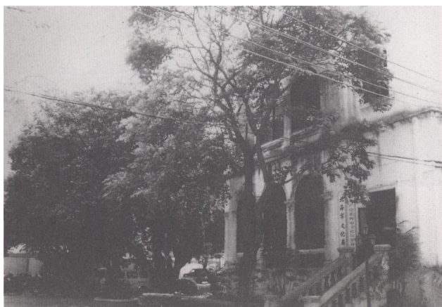
德国森宝洋行旧址现位于北海市文化大院内

100多年前各国在北海开设的洋行中，还有德商捷成洋行、法商孖地洋行，现仅存德国森宝洋行旧址，成为北海开埠以来外国资本渗入的历史物证。该旧址于1995年、1994年和2001年分别被公布为市级、自治区级和全国重点文物保护单位。