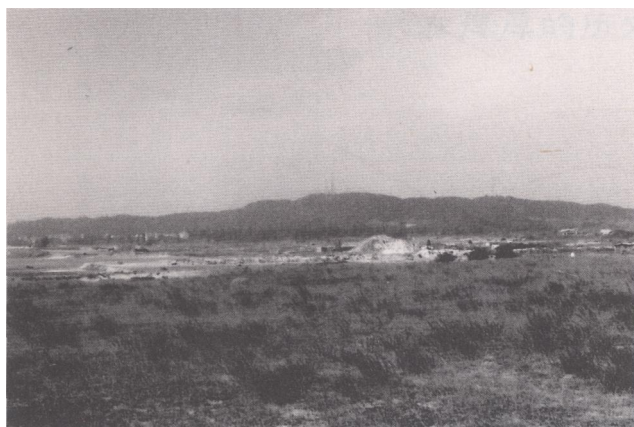
冠头岭南端，历史悠久的南漓村就在临海的岭脚下

尽管南漓历经近400年的沧桑，现在还是一个小村子，可在北海的历史上，南漓村的形成不但先于北海，而且其先辈又是古里寨设立后在这片土地上生活最早的先民，为北海日后的形成、开发和发展，起着开山祖的作用。