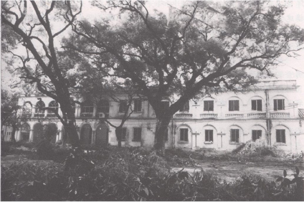
北海原圣德修院旧址，左边为原英领馆，右边为按原英领馆风格扩建的建筑。昔日的圣德修院和主教府楼，被市民称为“红楼”