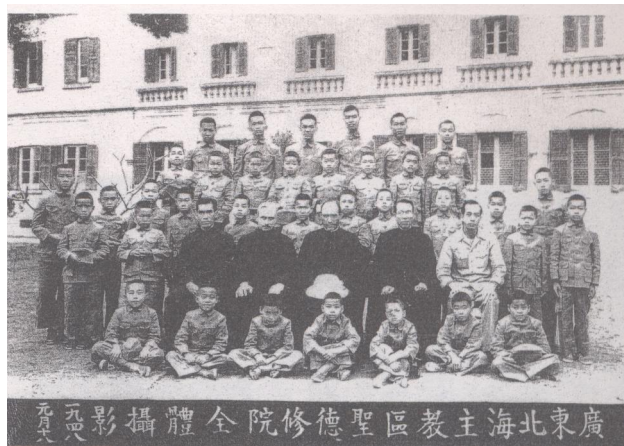
1948年北海圣德修院的4位神父（穿黑衣者）和全体修生在圣德修院前合影（解放前拍的照片复印件）