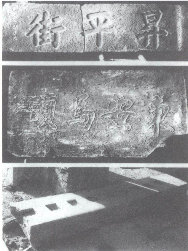
自上而下分别为“升平街”路碑，“东安马头”碑和闸门石脚