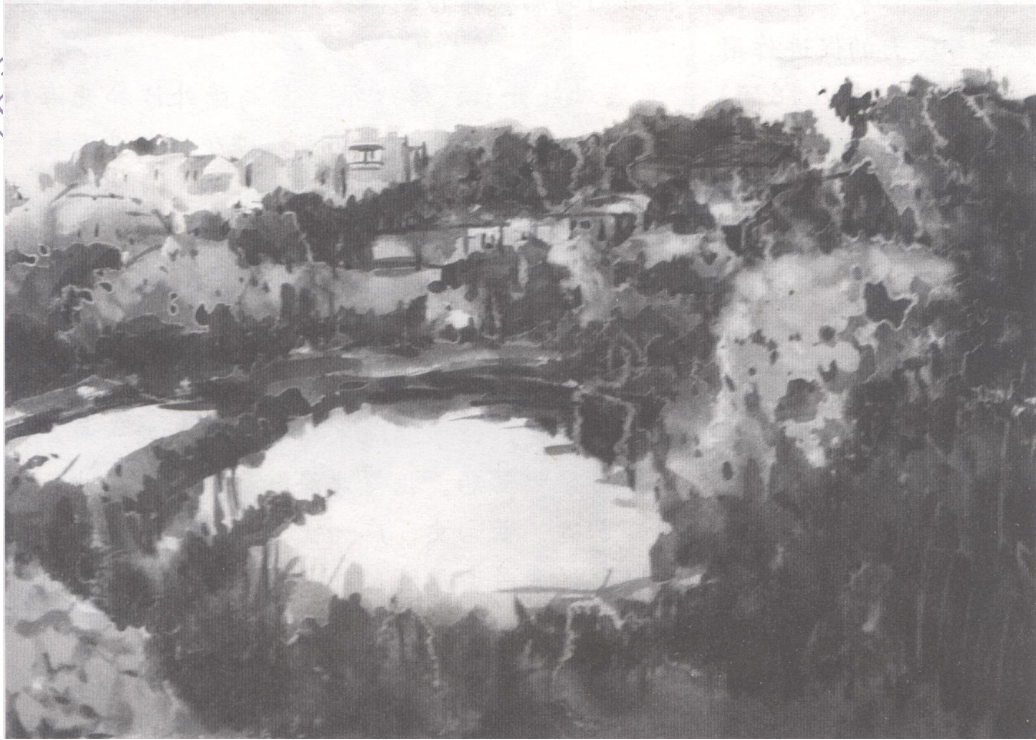
高德北面的临海地带，还保留着早期的渔村风貌，是一处风景优美的净土。图为高德风光一瞥。蔡道东画