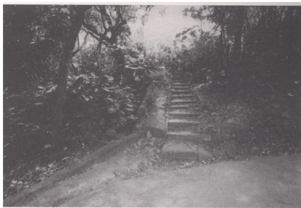
这条石级路又称“布路”