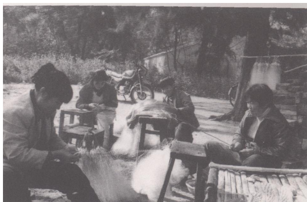
高德外沙渔民家属在织网