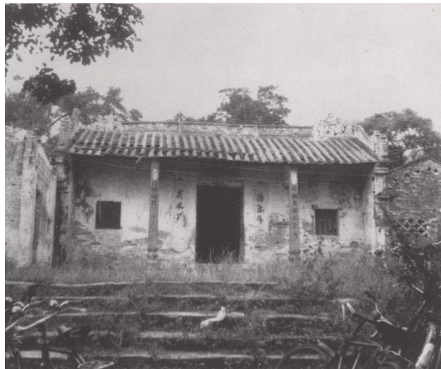
1926年，南满的第一间初级小学，就设在村内这间武帝庙内