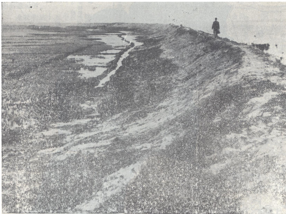
图为南康公社围海造田之一

南康公社部分村庄是合浦县革命老区。在党的领导下，一九四五年扫管龙、粟山等地人民群众积极开展游击战，狠狠打击反动势力，为解放合浦作出了贡献。