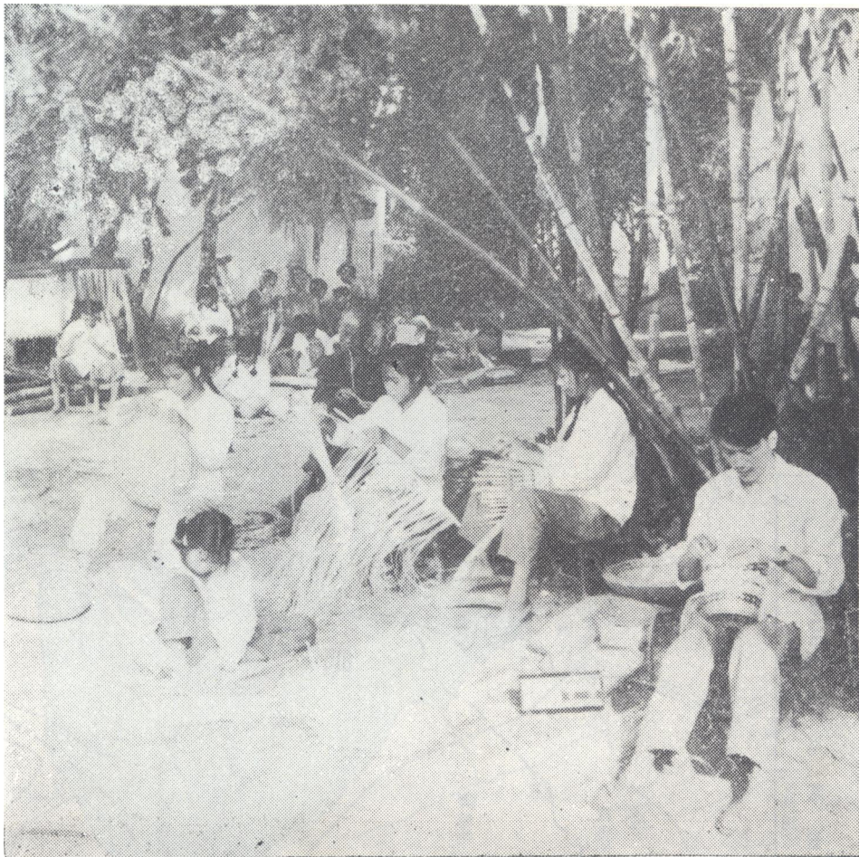
山南大队社员在编织竹器

合浦县城至湛江、合浦县城至沙田公社公路均在该公社驻地通过，交通方便。永安大队境内的大士阁，是自治区文物保护单位。