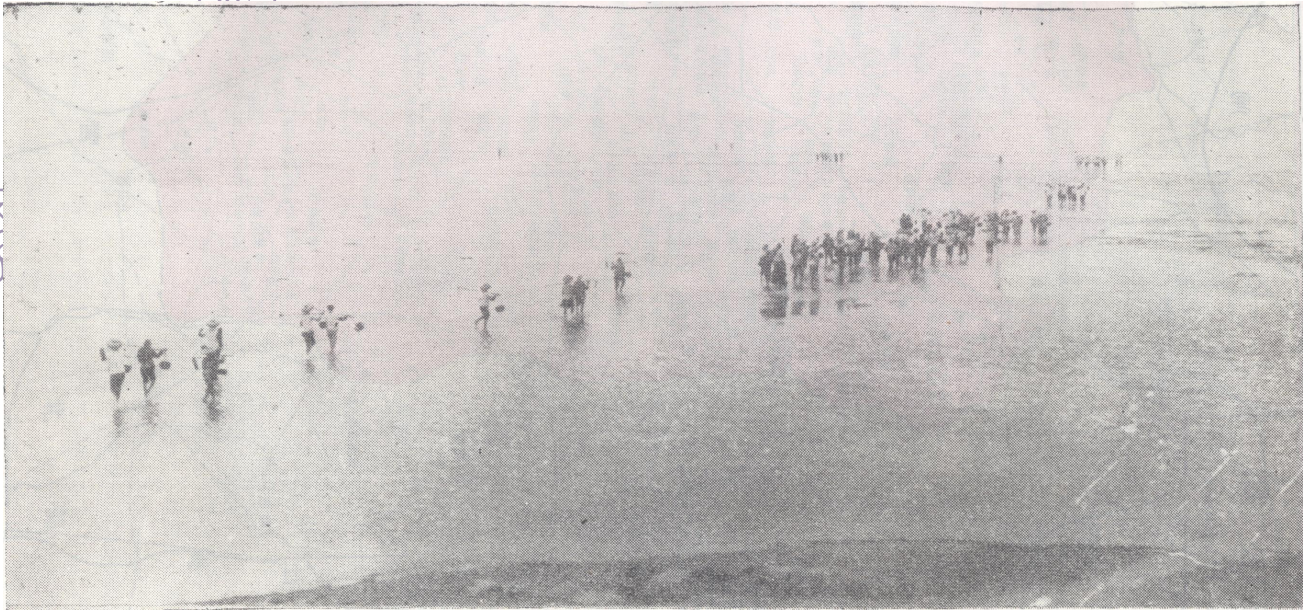
图为往海边挖沙虫的人群