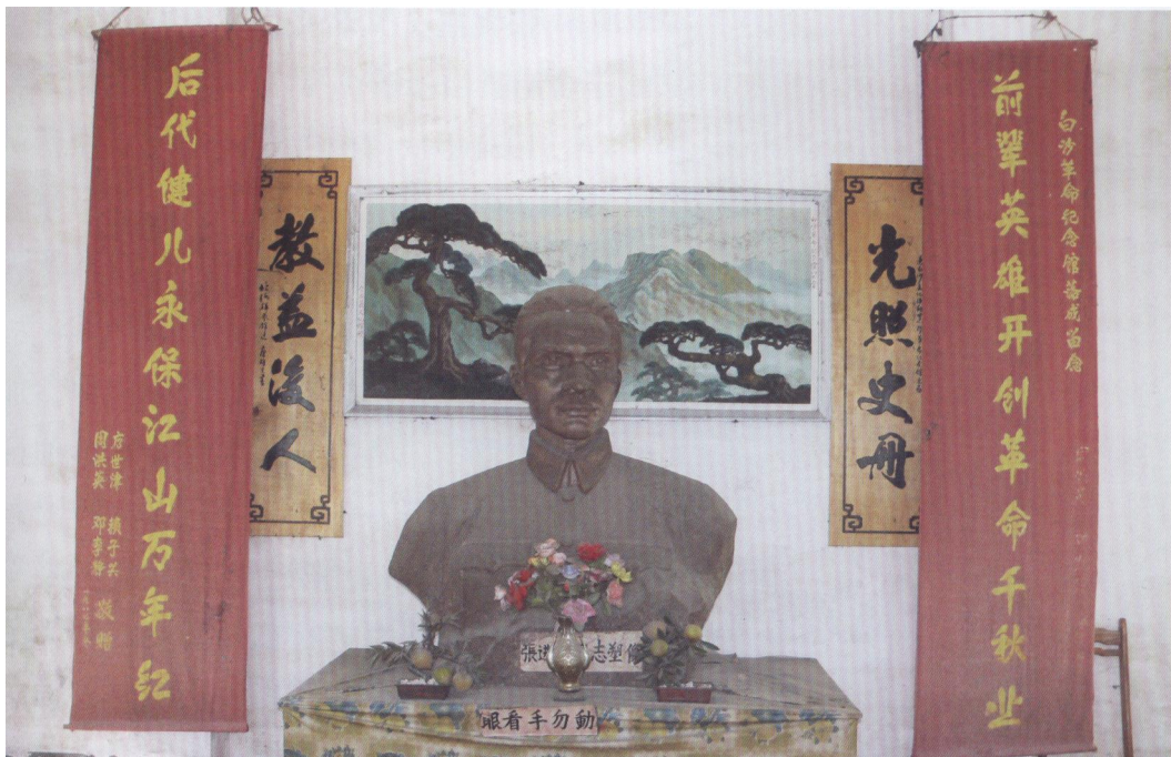
在白沙革命纪念馆内展出的张进煊雕像

为纪念白沙地区革命斗争的历程和老一辈革命者为党和祖国解放事业做出贡献和为国捐躯的英烈们，合浦县委、县政府于1987年拨款建成此馆。