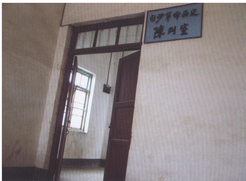
在白沙革命纪念馆内的白沙革命历史陈列室