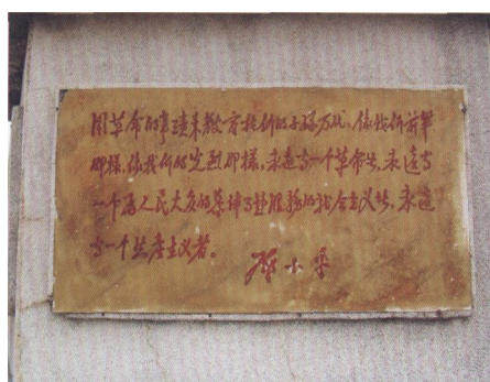
在纪念碑碑座上转摘的邓小平语录