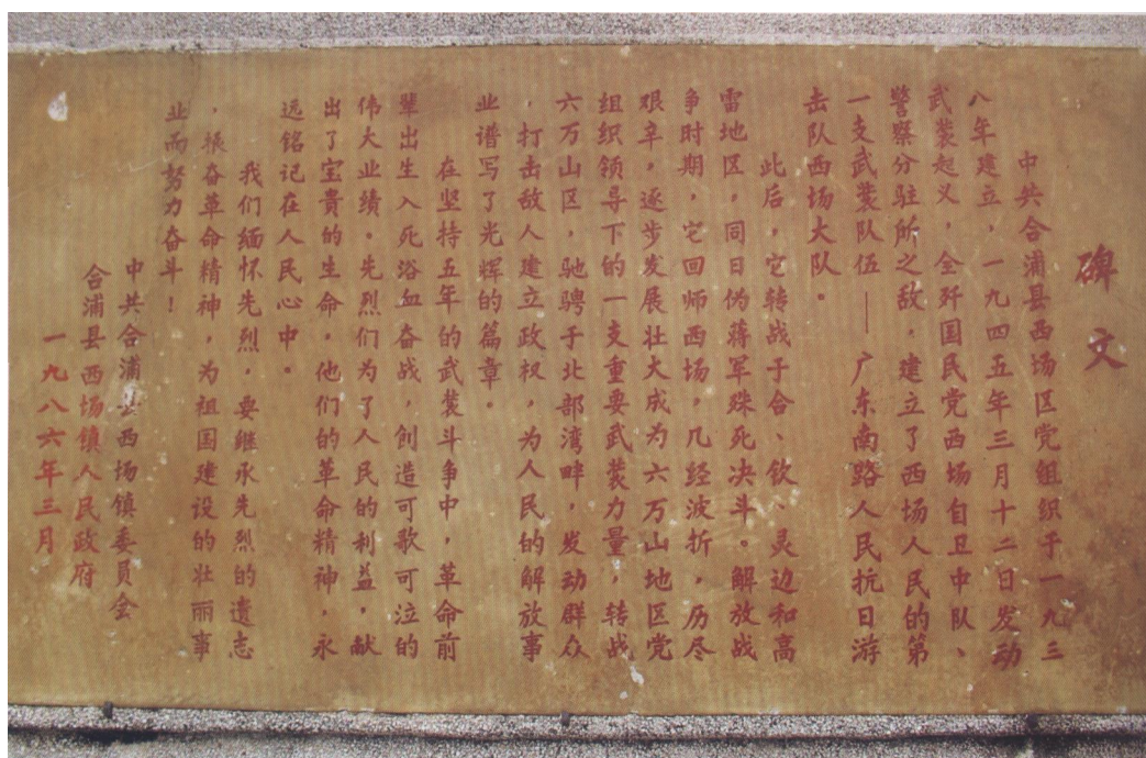
西场革命烈士纪念碑碑文

月建了一座烈士墓。后西场镇党委、政府于1984年春破土动工兴建此革命烈士纪念碑，1986年3月竣工。每逢清明、“七一”等节日，西场镇都组织社会各界群众和学生到纪念碑前开展缅怀革命先烈、进行爱国主义教育等活动。