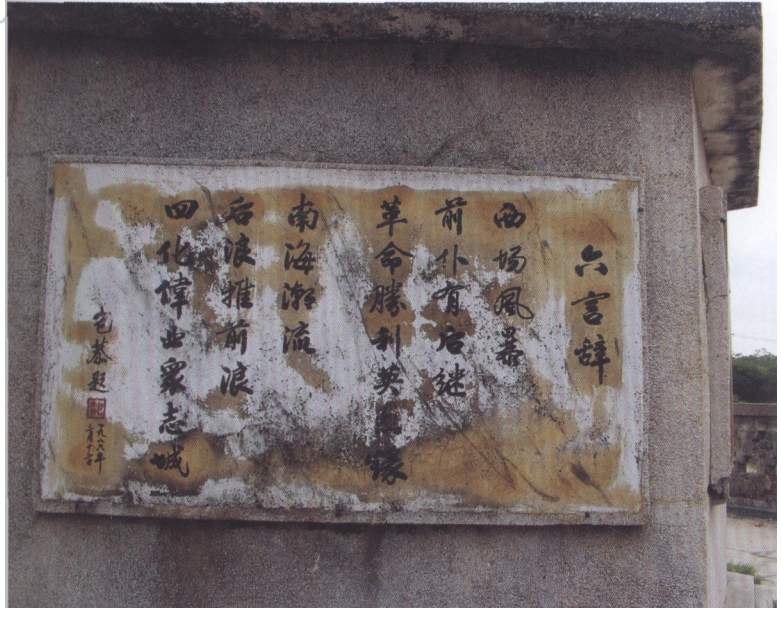
包恭为纪念碑献词