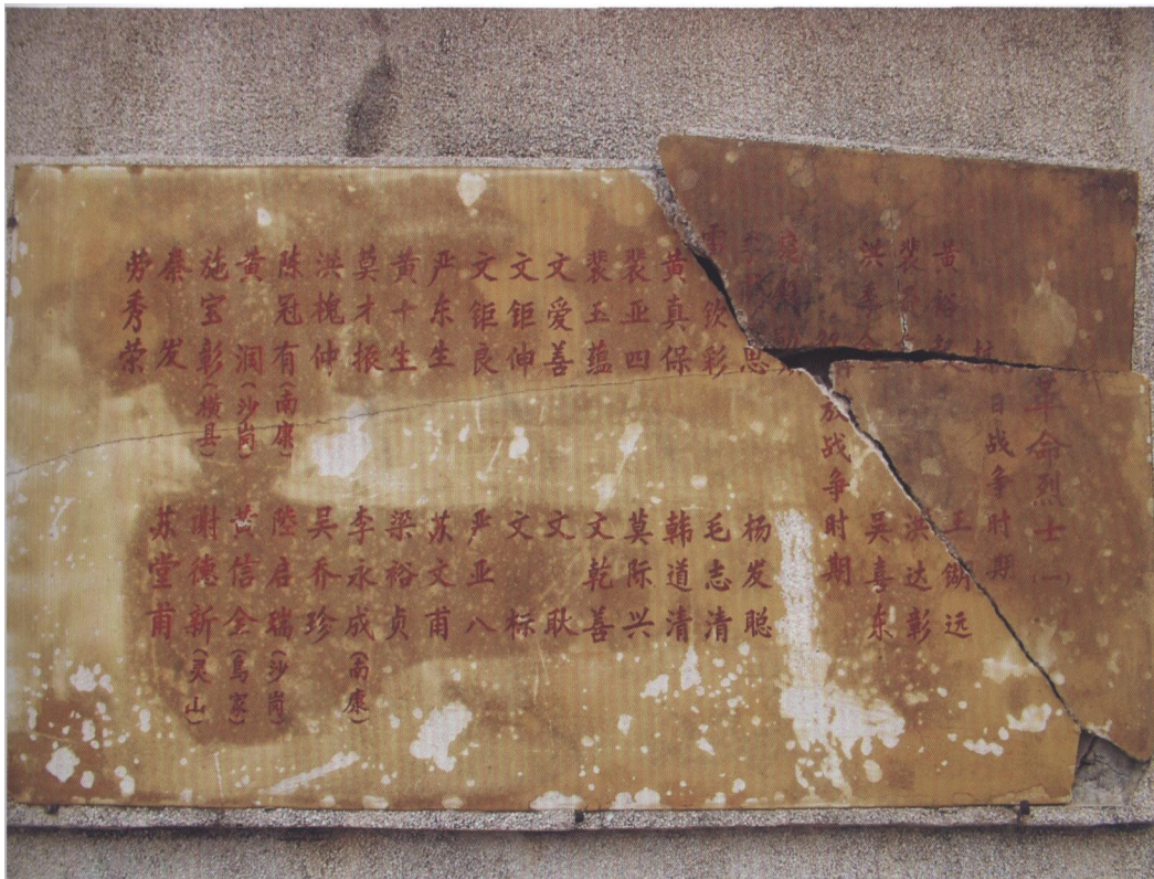
纪念碑上的烈士名单