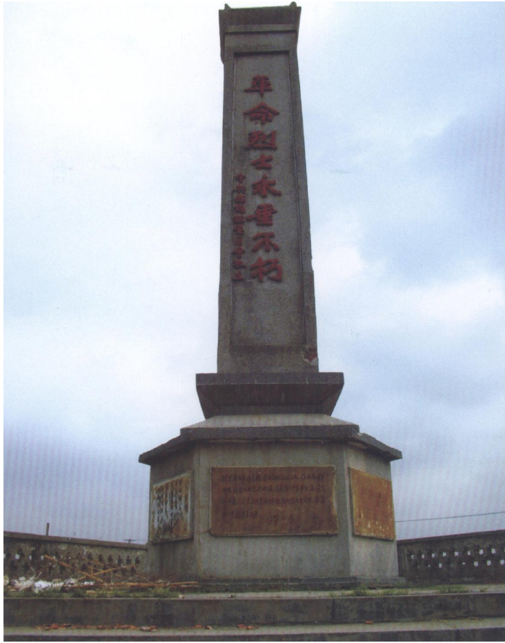
西场革命烈士纪念碑