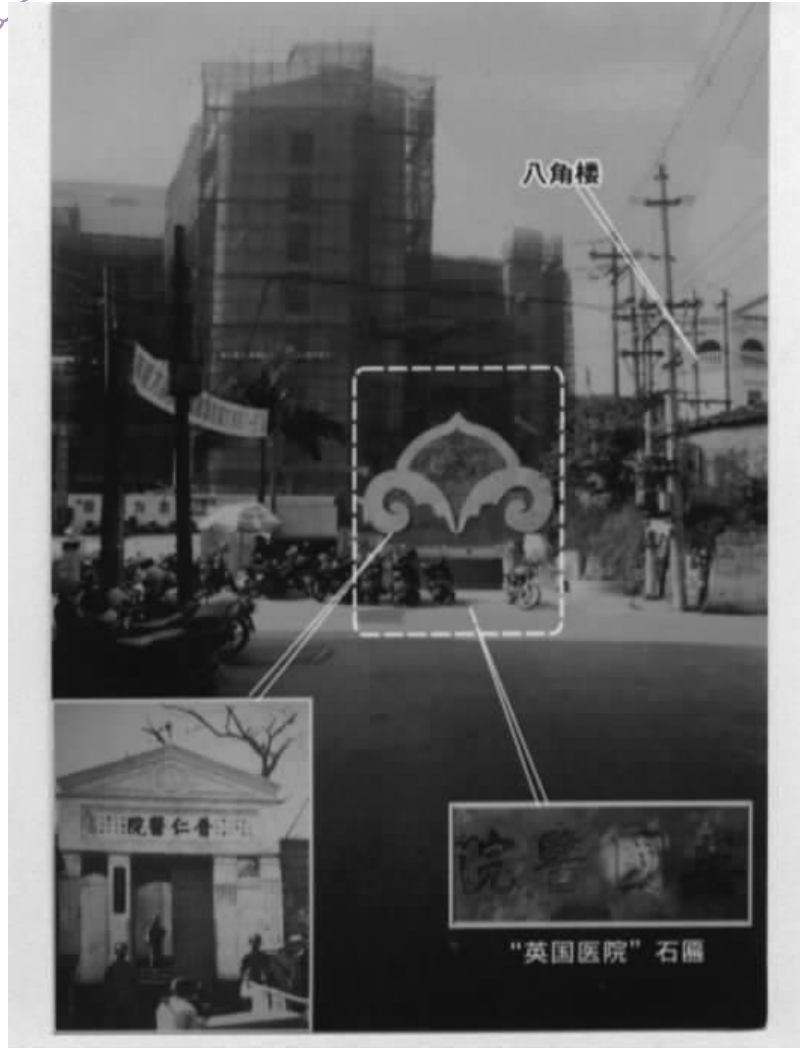
此图摄于 2001 年，图上方的建筑为当时正在建造中的市人民医院门诊大楼。图中的方框位置是昔日普仁医院大门（见左下角）的位置，英国医院”石匾（见右下角）是于 1987 年在此位置的地下发现的。