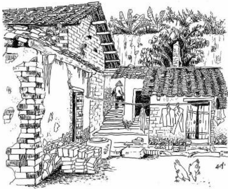
这些房屋虽破旧，今天仍在使用。