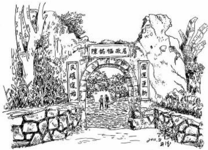
将军故居的牌匾就挂在这围屋的残垣断壁上。